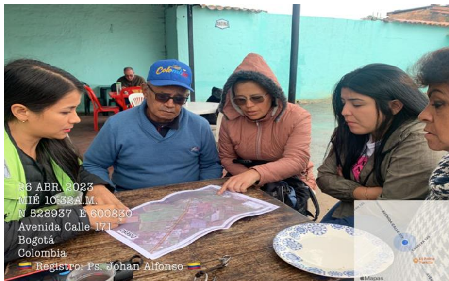
Fotografía 1. Recorrido Urbano realizado el día 26 de abril de 2023