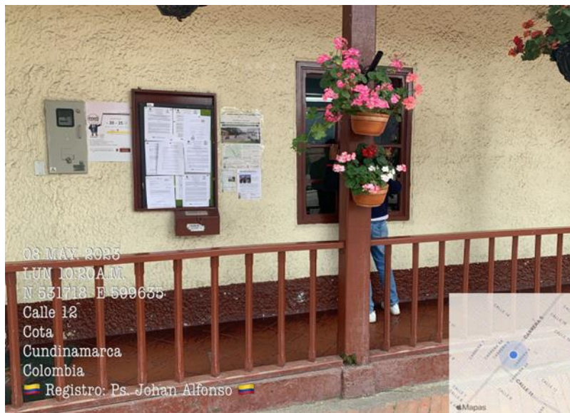
Fotografía 3. Revisión del estado de los puntos PSI.